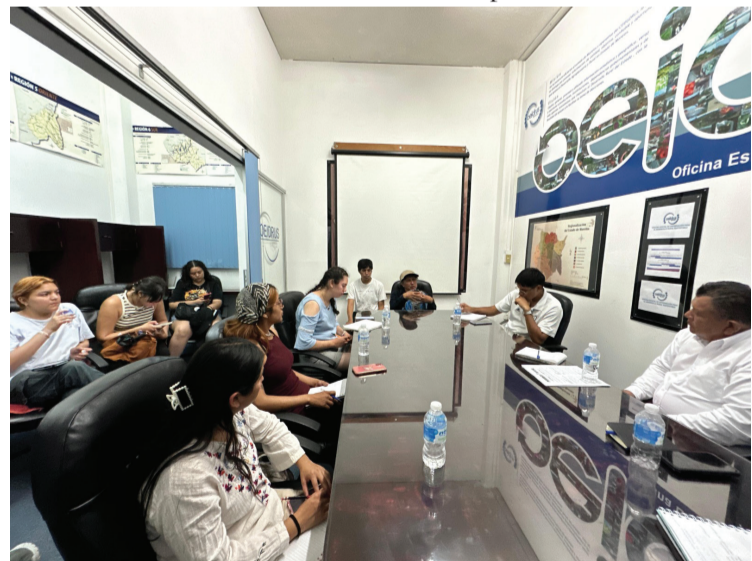
LA SECRETARÍA DE Desarrollo Agropecuario (Sedagro) sostuvo un encuentro con docentes y alumnos de la Universidad Autónoma Chapingo, donde compartieron información y experiencias sobre del sector.

nal, así como de acercarlos a los avances e innovaciones para profesionalizarlos ante los nuevos escenarios agroalimentarios. Finalmente, coincidieron que contribuir al desarrollo de la educación, es de suma trascendencia para brindar la oportunidad de formación integral a jóvenes por medio de una institución que los prepare tanto para el trabajo productivo del campo como para sus estudios posteriores.