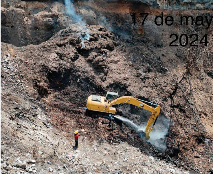
ESTE SÁBADO INICIARON los trabajos financiados con recursos económicos del Fondo Verde, gestionados por el Gobierno de Jiutepec, para atender la contingencia producto del incendio ocurrido en la exmina de tezontle en la Avenida Tezontepec de la colonia Centro.

combustión. 4.-De la misma manera inició y se estará realizando un monitoreo permanente de los niveles de explosividad conforme a la Norma Oficial Mexicana NOM-OSHA (niveles de carbono, dióxido de carbono, dihidrógeno, azufre y gases combustibles). 5.-El viernes 17 de mayo ingresó una máquina para la creación de una pendiente para facilitar la entrada a los diferentes niveles en los que se encuentra la mina y favorecer el acceso del personal de la Dirección de Protección Civil y Rescate del Gobierno de Jiutepec para enfriar los puntos al interior del lugar. 6.-El gobierno de Jiutepec cuenta con la asesoría de Construcción Terol S.A. de C.V. para la realización de las obras que tienen como finalidad procurar la salud de la población y mitigar los riesgos ambientales.