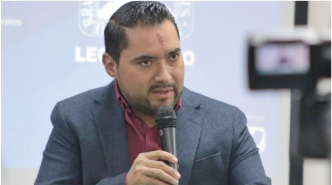
JOSÉ BLAS CUEVAS Díaz, Auditor General de la Entidad Superior de Auditoría y Fiscalización del Congreso del Estado, destacó que se hallaron observaciones por un total de casi 109 millones de pesos, principalmente derivadas de licitaciones irregulares que no cumplían con los requisitos legales.