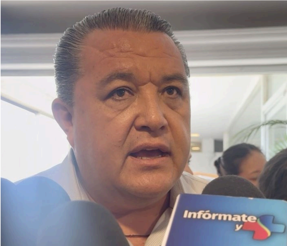
LA RECIENTE PROHIBICIÓN de comida chatarra en los planteles educativos de Morelos, generará un impacto económico negativo en el sector del comercio de la entidad.

Comentó que, la medida impactará negativamente a pequeños negocios cercanos a planteles educativos, que en muchas ocasiones la principal fuente de ingresos. "Esta medida afectará directamente a las tiendas de abarrotes que se encuentran cerca de las escuelas, las cuales representan el sustento de cientos de familias morelenses", expresó Según el líder, los pequeños comerciantes que dependen de la venta de estos productos verán una disminución considerable en sus ingresos, situación que podría agravarse en un contexto económico ya de por sí complicado para el sector. Señaló su preocupación de balancear las ventas con la sustitución de otro tipo de mercancía, sin embargo, indicó que, la prohibición forma parte de una estrategia nacional para combatir los altos índices de obesidad infantil y problemas de salud relacionados con el consumo excesivo de alimentos chatarra en edad escolar.