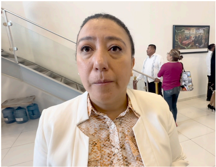
EN LAS ESCUELAS ubicadas en Cuernavaca, Temixco, Huitzilac y Jiutepec, son las que reportan una mayor venta y consumo de drogas, informó el Tribunal Unitario de Justicia para Adolescentes.

"Por lo menos nos han hecho reportes en Temixco, en Huitzilac, en Cuernavaca, en Jiutepec, pero en realidad prácticamente en todos los municipios que hemos visitado hay por lo menos una escuela en donde se han hecho reportes de esta naturaleza", dijo. Pineda Fernández concluyó, al mencionar que las principales drogas que consumen los menores en el estado son la marihuana y el cristal, por lo que continuarán con estas pláticas de prevención.