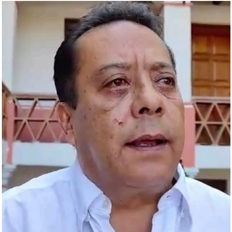
PARA ESTE PRIMER fin de semana largo del 2025 los municipios de Tepoztlán, Cuernavaca y el Lago de Tequesquitengo, serán las zonas con mayor llegada de turistas.