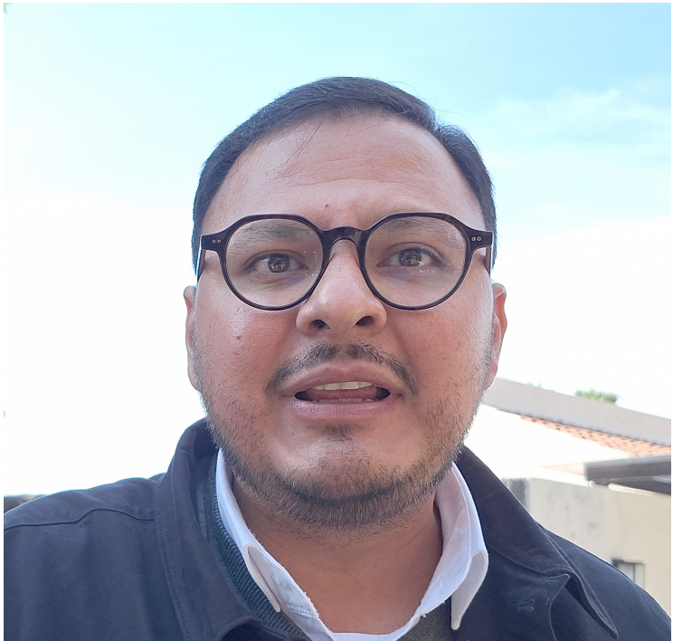
LA SECRETARÍA DE Bienestar Social del Gobierno federal pidió la población no dejarse engañar por falso personal para realizar consultas médicas y para levantar el censo del programa Salud Casa por Casa

mente gratuito. "Los programas son totalmente no se dejen engañar, si les piden una cantidad de dinero es un engaño. Les pedimos que denuncien ante la Fiscalía General del Estado en caso de ser víctima de fraude", finalizó López Rodríguez.