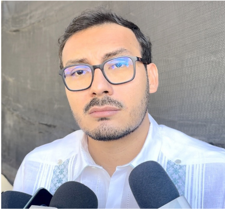
EL BOSQUE DE Agua ha perdido más de cuatro mil hectáreas, a causa de la tala ilegal durante los últimos cinco años, así lo dio a conocer el secretario de Desarrollo Sustentable (SDS), Alan Dupré Ramírez.

bitan entre los límites del estado. “ Cuando empezó el tema de la pandemia, el gobierno no estuvo operando tanto en territorio y los talamontes aprovecharon para avanzar mucho”, agregó. Ante la tala ilegal que arrasa miles de hectáreas de la superficie de bosques, la Secretaría de Desarrollo Sustentable trabaja con la Agencia de Transformación Digital para adquirir una licencia de tomas satelitales y poder sustituir los recorridos terrestres que tardan más tiempo y dinero. “Alguna licencia de tomas satelitales que nos permitan de manera más barata y más eficiente tener datos rápidos”, agregó. El secretario Dupré Ramírez, reveló que, esperan la temporada de lluvias para dar inicio con el proceso de reforestación, para que a partir el próximo mes de mayo se planten un millón de árboles del próximo vivero estatal que estará ubicado en el municipio de Cuernavaca.