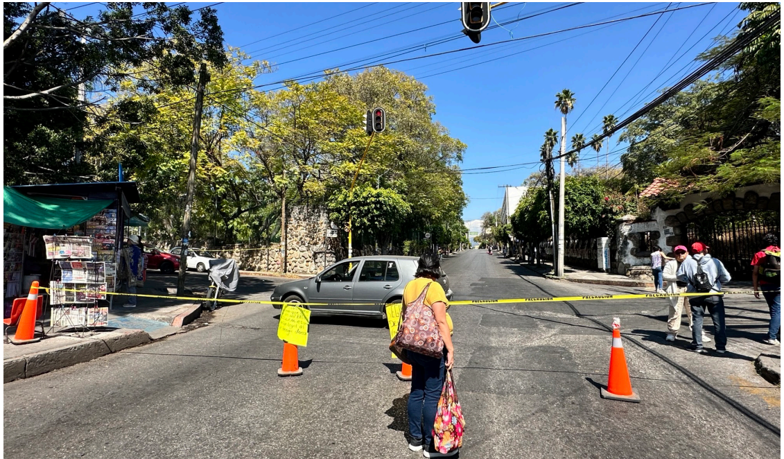
JUBILADOS Y PENSIONADOS del Ayuntamiento de Cuernavaca, se volvieron a manifestar para exigir que se les incorpore al Instituto de Crédito para los Trabajadores al Servicio del Gobierno del Estado.

tación provocó graves problemas vehiculares sobre la avenida Morelos, Álvaro Obregón, bulevar Benito Juárez y en la glorieta del Niño Artillero.