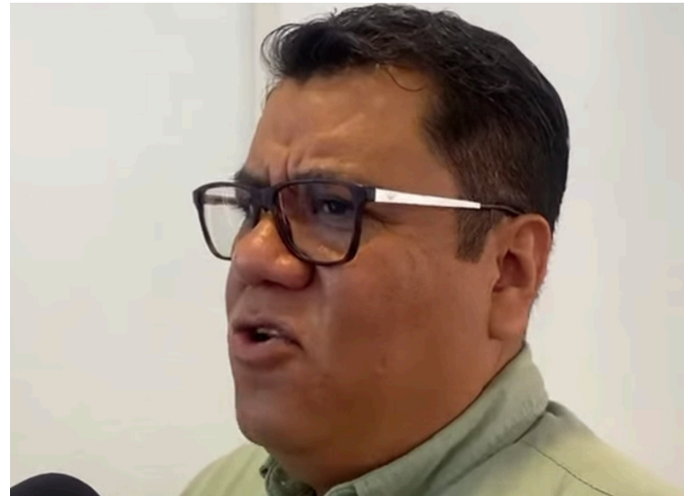
EMPRESARIOS DE MORELOS hicieron un llamado a las autoridades de los tres niveles de gobierno para reforzar la seguridad durante este primer fin de semana largo del año, con la finalidad de garantizar la seguridad de los turistas.