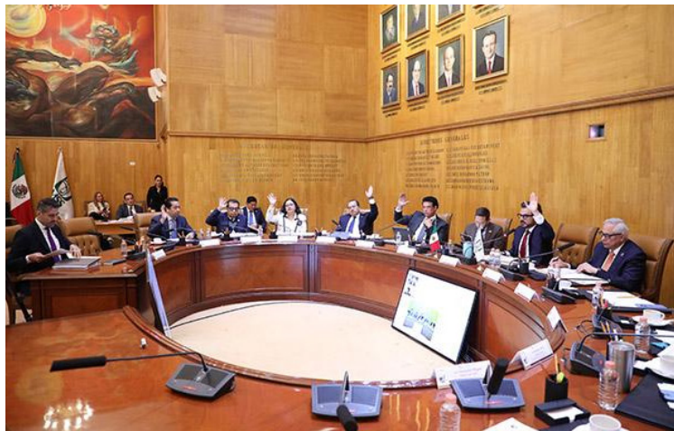
El H. Consejo Técnico del IMSS aprobó la ratificación del otorgamiento de compensaciones a médicos especialistas para la cobertura de plazas vacantes en zonas de difícil cobertura; esta medida beneficiará a 246 unidades médicas.