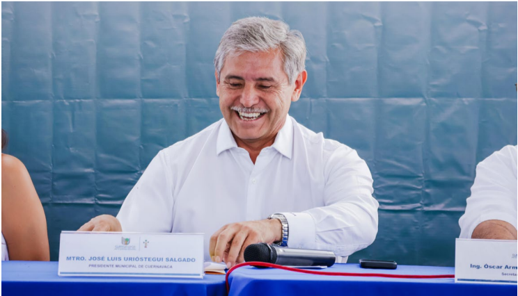
EL PRESIDENTE MUNICIPAL de Cuernavaca, José Luis Urióstegui Salgado, informó que su administración evalúa la firma de un convenio propuesto por el gobierno del Estado.

ceso de cobro. Este esquema podría generar ingresos adicionales para el estado por más de 500 millones de pesos, y en el caso de Cuernavaca, hasta 50 millones de pesos extra mediante el acceso a fondos de fomento estatal. “Todavía no hemos decidido si firmaremos el convenio, pero tengo entendido que al menos 13 municipios ya han mostrado interés”, señaló el edil. El alcalde recalcó que el programa propuesto por el estado es únicamente de carácter recaudatorio. Las decisiones fiscales, incluyendo las tablas de valores y las contribuciones, seguirán siendo competencia exclusiva del municipio. Además, enfatizó que no habrá afectaciones para los usuarios, ya que los Certificados de Cumplimiento Fiscal (CFI) seguirán siendo expedidos por el municipio, no por el estado.