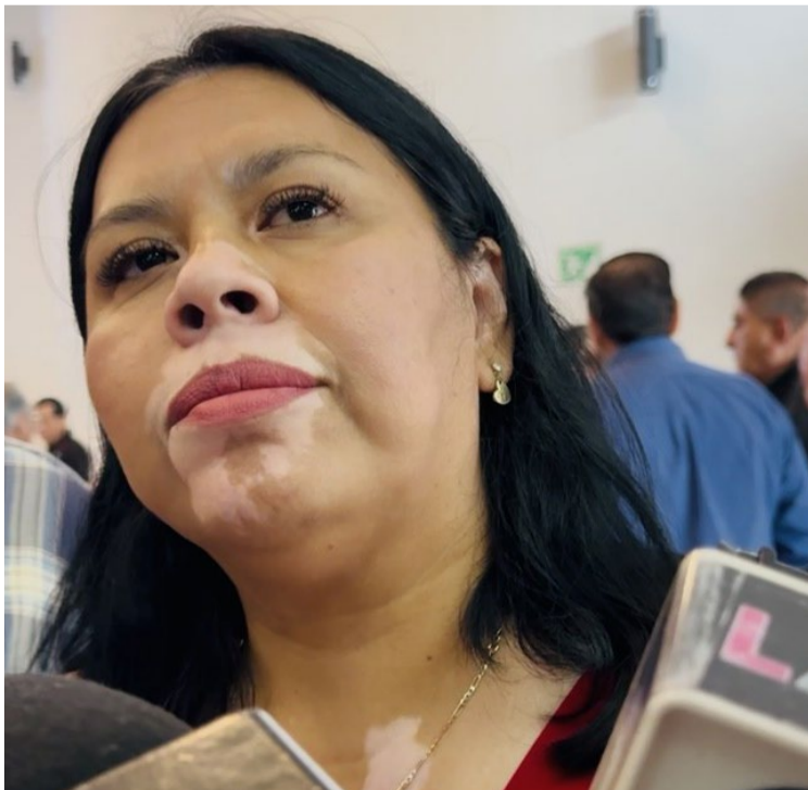
LA FISCALÍA AMBIENTAL de Cuernavaca impondrá sanciones económicas de hasta 60 mil pesos en contra de empresas que contaminen el suelo, por abandonar sus residuos sólidos en la vialidad pública y no respetar el horario del servicio de recolección de basura.