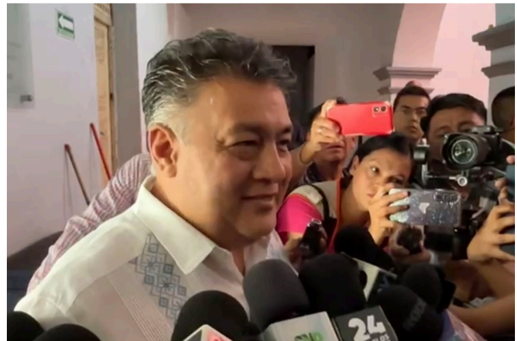
LUEGO DE QUE se diera a conocer que la Fiscalía General de la República está investigando a seis alcaldes por tener presuntos nexos con la delincuencia organizada, la Secretaría de Seguridad y Protección Ciudadana aseguró que se seguirá trabajando con ellos en el combate a la delincuencia, ya que se debe garantizar la presunción de inocencia.

pio de inocencia", explicó. Urrutia Lozano agregó que, también hay algunos presidentes municipales que están siendo presionados por los delincuentes para operar en sus localidades, por lo que se está trabajando con ellos para detener a estos grupos que se dedican principalmente a la extorsión. "Hay que recordar que tenemos sendas denuncias de varias síndicas y de varios regidores que han sido amenazados por parte de los grupos criminales, tal es el caso de Amacuzac a un regidor que aún todavía no lo hemos podido encontrar, entonces es una averiguación pendiente que estamos dando seguimiento (...) lo que pasa es que hay carpetas de investigación en proceso en la Fiscalía y yo también tengo que ser responsable de cuidar la integridad física de esos alcaldes, acuérdense que el presidente municipal de Ayala, al principio de esta administración, tengan muy presente, se dio un operativo en conjunto en Ayala con la presencia de estas amenazas, tenemos actualmente el alcalde de Tlayacapan que tiene esta situación y que también tiene que ver con la situación de la ruta 14", concluyó Urrutia Lozano. Y es que cabe recordar, que en días pasados el delegado de la Fiscalía General de la República, Hugo Bello, declaró que hay por lo menos seis carpetas de investigación en contra de presidente municipales por su presunta relación con integrantes de la delincuencia organizada.