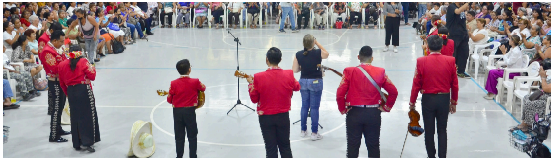
ESTE DOMINGO 11 de mayo, el municipio de Jojutla celebró con gran alegría y cariño a las madres en su día.