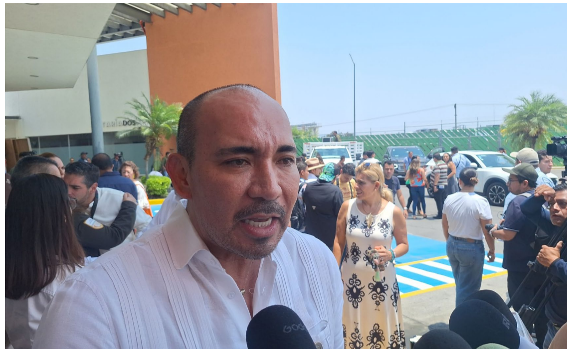
EL PODER EJECUTIVO negó que se haya roto la mesa de negociación con el Sindicato Único de Trabajadores del Poder Ejecutivo, Entidades Paraestatales y Órganos Constitucionales Autónomos (Fiscalía General del Estado).