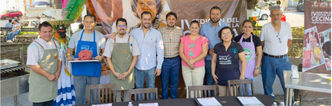
EL GOBIERNO DEL Estado de Morelos, a través de la Secretaría de Turismo, acompañó la presentación oficial de la Feria de la Cecina Ixtleca, evento que reconoce a este platillo como una de las expresiones culinarias más representativas de la región sur.