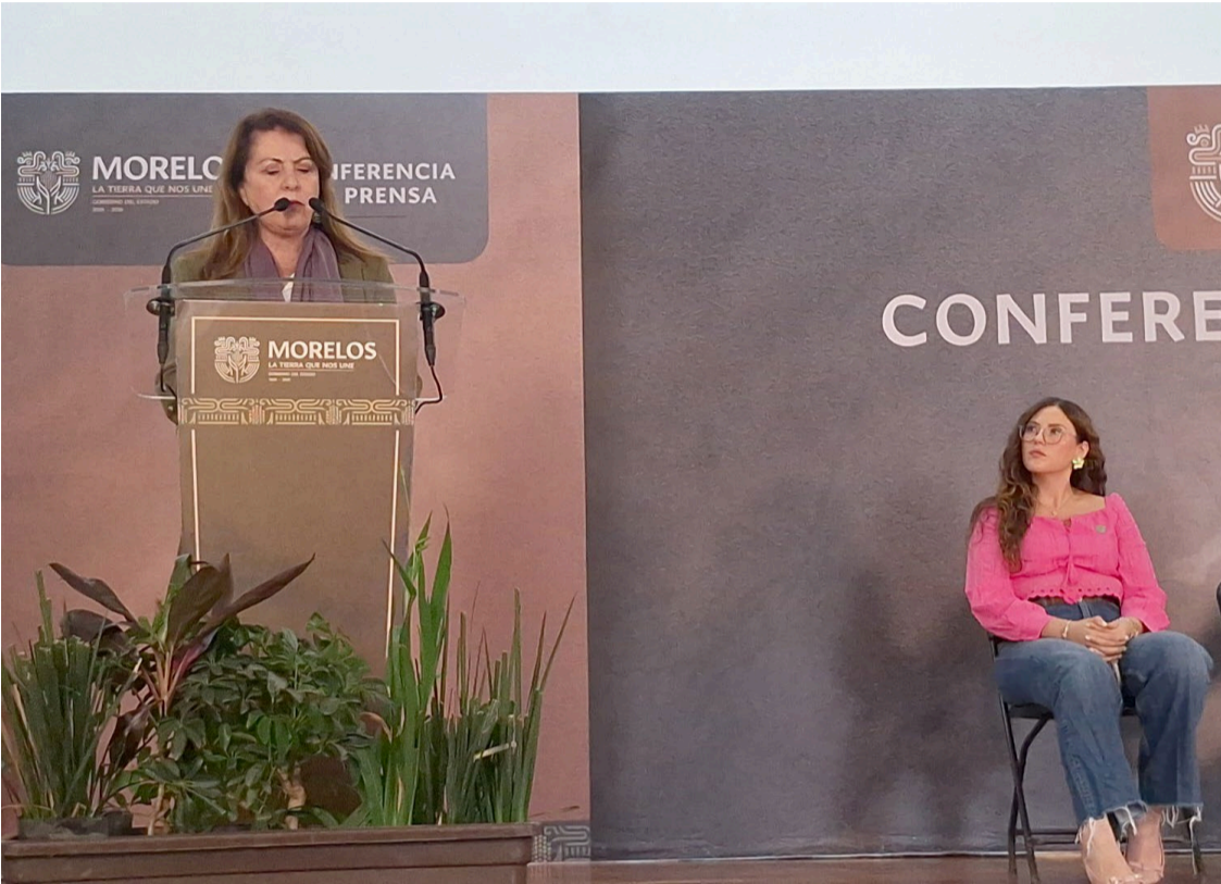
LA COORDINACIÓN DE Movilidad y Transporte es el sector más complicado de la administración estatal, reconoció la gobernadora, Margarita González Saravia.

También, subrayó que ha puesto orden en la Coordinación, incluso presumió que actualmente existe un mayor orden en la atención dentro de la dependencia estatal. Sostuvo que, anteriormente gestores acaparaban las ventanillas y los ciudadanos eran atendidos en una sola caja, pero subrayó que, la situación fue corregida para brindar un mejor servicio. Por otro lado, destacó que ha funcionado el sistema de citas para evitar el acaparamiento de ventanillas por parte de gestores. Además, la mandataria estatal invitó a la población a realizar el canje de las placas y aseguró que en menos de cinco minutos se realiza el cambio de las láminas. Por último, destacó la buena respuesta de la ciudadanía, que esperó durante varios meses para recibir su placa metálica, e invitó a quienes aún no han realizado el trámite a agendar su cita en el sitio web: citas.morelos.gob.mx .