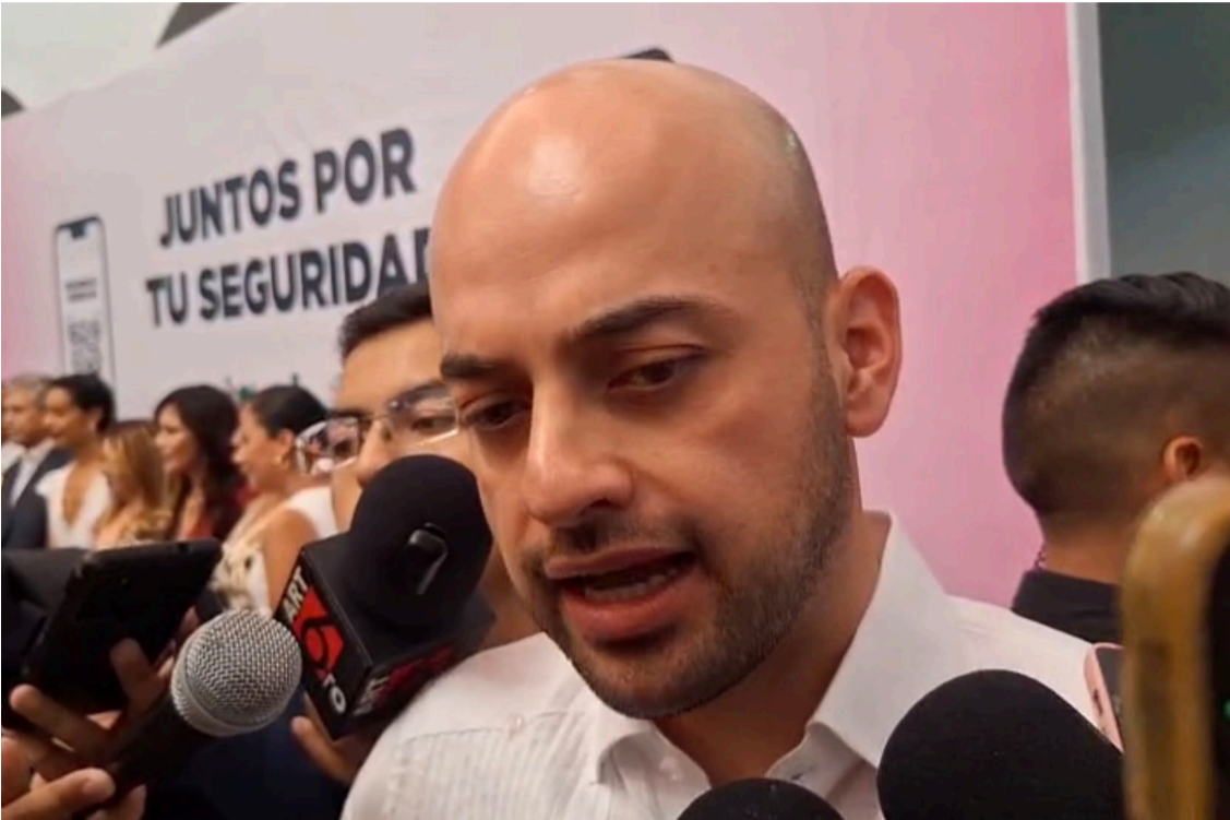
LA FISCALÍA GENERAL de Morelos continúa con la investigación en contra del ex gobernador, Cuauhtémoc Blanco Bravo, acusado del delito de violación en contra de su media hermana.

de que hubiera alguna resolución, esta Fiscalía siempre actuará en estricto apego a derecho”, explicó. Además, señaló que la Fiscalía está protegiendo a la víctima y recordó que el ex gobernador se encuentra en un proceso legal para que se le otorgue la información de la denuncia en su contra. “El diputado federal compareció como ustedes saben ante la Fiscalía, ahí se le hizo sabedor de los alcances en esa participación, como saben, posteriormente fue con sus abogados con un juez para solicitar ese auxilio, a la fecha pues están dadas las circunstancias porque la prioridad también de la Fiscalía es poner al centro a las víctimas, respetar en todo momento a la víctima”, dijo. Edgar Maldonado concluyó, al mencionar que en cuanto se tengan avances en las investigaciones se podrá analizar si se volverá a solicitar al Congreso de la Unión su desafuero.