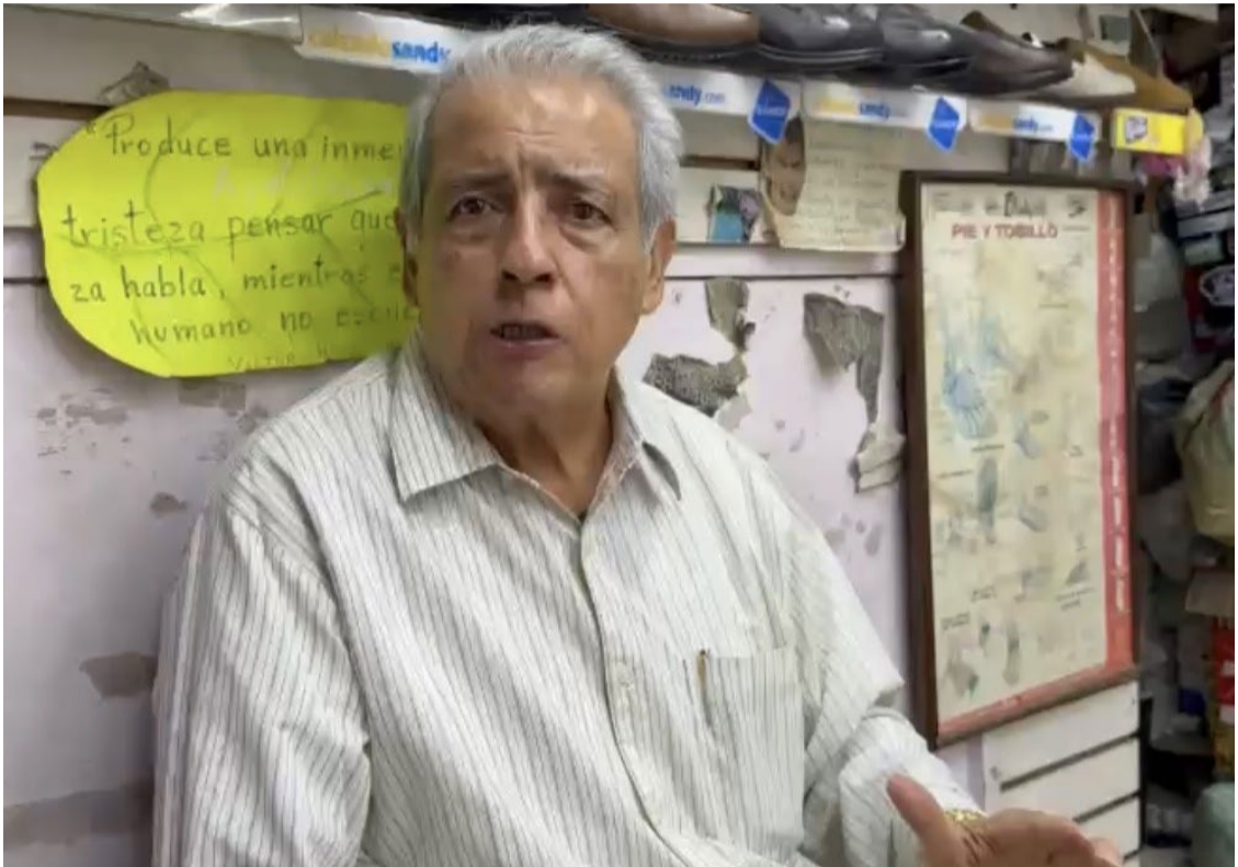
EL COMERCIO FORMAL y el ambulante también son los responsables del problema de la basura en las calles de la ciudad capitalina, además de los indigentes, según el líder comerciante, Eduardo Peimbert Ortiz.

los responsables de la basura que se encuentra en calles de Cuernavaca, solicitando un mayor control del comercio informal.