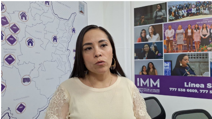
EN ESCUELAS PÚBLICAS existen casos de abuso sexual contra alumnas y acoso laboral contra maestras.

miento contra maestras. La presidenta del IMM detalló que se han identificado incidentes en escuelas públicas de los municipios de Jiutepec, Xochitepec, Cuautla y Cuernavaca. Asimismo, puntualizó que estos casos han sido detectados durante los talleres que el Instituto imparte en los centros escolares para prevenir y atender la violencia. Señaló que realizan cursos de prevención en las escuelas para evitar la normalización de la violencia y fomentar la denuncia. Finalmente, concluyó: "En las escuelas primarias y secundarias hemos identificado casos de violencia tanto contra docentes como contra niñas, niños y adolescentes".