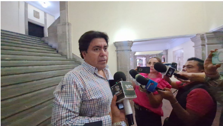
DURANTE LA PANDEMIA por COVID-19, más de cinco mil niñas y niños no fueron registrados

mos entre 15 y 20 registros diarios”, indicó. Explicó que muchos menores nacidos durante el periodo más crítico de la emergencia sanitaria no contaban con acta de nacimiento, por lo que se implementó un programa de regularización para garantizar su derecho a la identidad. Aunque reconoció que el número de menores sin registro ha disminuido significativamente, subrayó la importancia de continuar con estos esfuerzos hasta eliminar por completo el rezago. Finalmente, recordó que las niñas y niños pueden ser registrados de manera ordinaria hasta los siete años de edad. Después de esa edad, el trámite se considera extemporáneo, aunque continúa siendo gratuito.