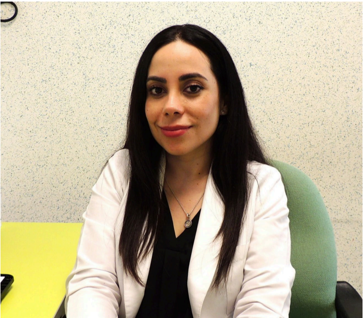
AUTORIDADES DEL HOSPITAL del Niño Morelense (HNM) recomendaron a las familias mantener medidas de higiene para prevenir que las y los infantes contraigan la enfermedad de hepatitis