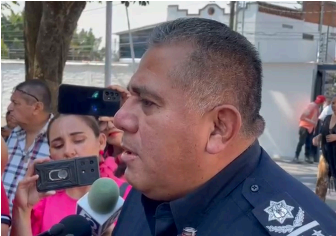
CON EL OBJETIVO de reducir la incidencia delictiva, la Secretaría de Protección y Auxilio Ciudadano de Cuernavaca iniciará operativos de revisión de vehículos y motocicletas para detectar a conductores portando armas de fuego

y evitar que lleven armamento”, señaló. García Delgado hizo referencia a los recientes ataques ocurridos este martes en las colonias Carolina y Chipitlán, donde, en ambos casos, los hechos fueron intentos de robo, pero las víctimas fueron lesionadas con armas de fuego al resistirse. “Ayer tuvimos incidentes en los que intentaron robar motocicletas en Chipitlán y la colonia Carolina, en uno de los casos, también se trataba de una persona dedicada a la venta de terrenos”, relató el funcionario. Finalmente, García Delgado destacó que, gracias a los operativos implementados en las últimas semanas, ha disminuido la incidencia de robos y homicidios en la ciudad.