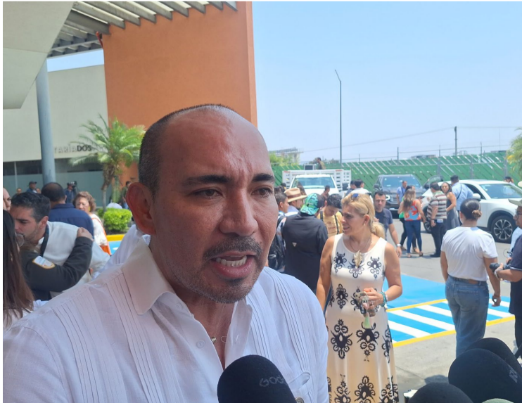
EL CONFLICTO ENTRE el Gobierno del Estado y el Sindicato Único de Trabajadores del Poder Ejecutivo, Entidades Paraestatales y Órganos Constitucionales Autónomos persiste.

El secretario subrayó que, aunque el Gobierno está comprometido con un salario justo para los trabajadores, no se puede autorizar un incremento que comprometa las finanzas del estado ni afecte los programas sociales. "Estamos a favor de un salario justo, pero debemos asegurar que no se pongan en riesgo las finanzas del Estado ni los programas sociales a costa de este incremento salarial", expresó. Salazar Acosta explicó que la solicitud sindical incluye demandas de hasta un 150 por ciento de aumento en ciertos conceptos, lo que calificó como "insostenible". Además, reveló que también exigen la reactivación de plazas congeladas, lo que representa otro desafío para las finanzas públicas. El funcionario finalizó diciendo que el Gobierno estatal ha presentado varias propuestas, que varían entre el 3.5% y el 4.5%, basadas en análisis serios y no en decisiones arbitrarias. Afirmó que cualquier acuerdo debe estar dentro de los límites presupuestales y no poner en peligro el bienestar de los ciudadanos.