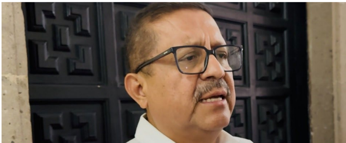
TRAS LA LESIÓN que sufrió una alumna de la escuela Narciso Mendoza de Cuautla, el pasado 30 de abril, el director del Instituto de Educación Básica del Estado de Morelos (IEBEM), Leandro Vique Salazar, declaró que no se trató de un caso de “bullying”, a pesar de que requirió de una cirugía en el brazo de la menor.

violentar el derecho humano del menor en el acceso a la educación. Por lo que, el IEBEM descartó caso de bullying en incidente escolar que requirió de intervención quirúrgica, en la cual no se ha aplicado ningún tipo de sanción al alumno que provocó el accidente. A pesar de la gravedad de las lesiones, que ameritaron una cirugía, Vique Salazar confirmó que no se aplicarán sanciones contra el estudiante involucrado en el incidente.