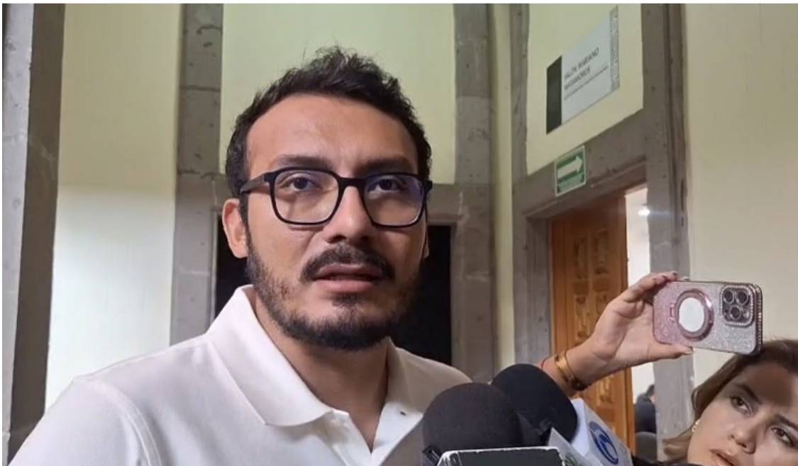
LA PROCURADURÍA FEDERAL de Protección al Ambiente (Profepa) clausuró de manera temporal el relleno sanitario "El Jabonero", ubicado en el municipio de Mazatepec