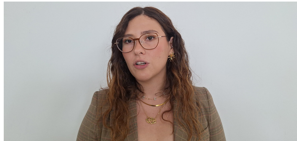
A MÁS DE UN mes de que se puso en operación en Morelos, el Código Violeta, la Secretaría de la Mujer no reporta casos de violencia hacia las mujeres.