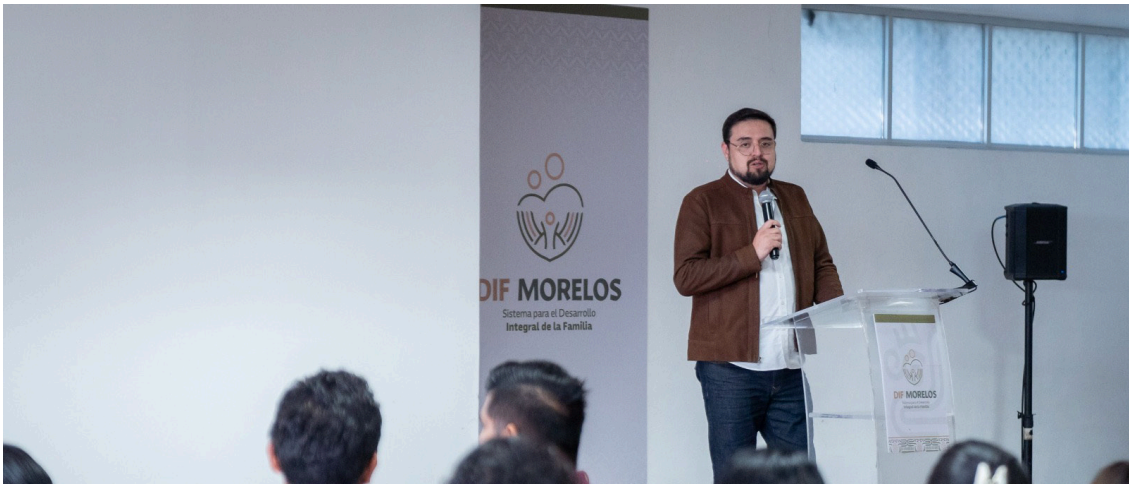
EL SEDIF MORELOS sostuvo un primer encuentro con titulares de los Sistemas DIF municipales que asumirán el cargo el próximo 01 de enero de 2025, en el cual, se dieron a conocer los programas sociales que pueden implementarse en sus demarcaciones.