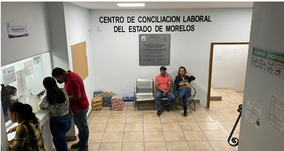
EL CENTRO DE Conciliación Laboral del Estado de Morelos informa que, con motivo del segundo periodo vacacional del ejercicio 2024, se suspenderán actividades del 23 de diciembre de 2024 al 05 de enero de 2025.