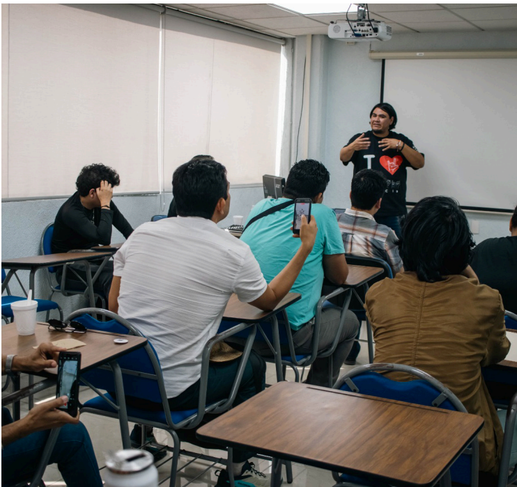
EL CONSEJO DE Ciencia y Tecnología del Estado de Morelos, presentó la conferencia “Herramientas de Inteligencia Artificial en los Robots NAO”, en el Departamento de Ciencias Computacionales del Tecnológico Nacional de México y el Cenidet.