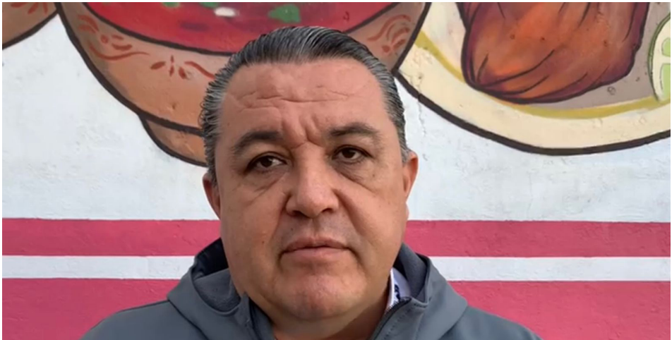
LA CÁMARA NACIONAL del Comercio en Pequeño hizo un llamado a las autoridades para reforzar la seguridad con el fin de atraer a más turistas durante esta temporada vacacional decembrina.