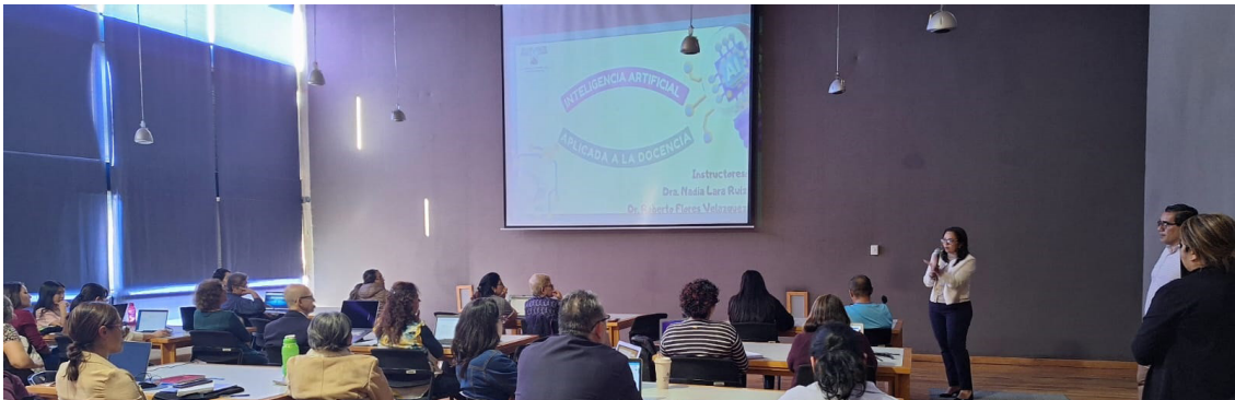
PARA BRINDAR HERRAMIENTAS pedagógicas y conocimientos de las nuevas tendencias tecnológicas, la UAEM, a través de la Secretaría Académica, impartió el curso taller IA en el diseño didáctico de la docencia a personal de la ENSP, dependiente del INSP.