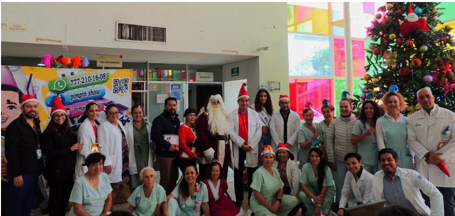
CON MOTIVO DE las festividades decembrinas, el Hospital del Niño Morelense (HNM) llevó a cabo una posada navideña dirigida a las y los pacientes de este nosocomio infantil, en la que disfrutaron de un show de payasos y recibieron alimentos y juguetes.