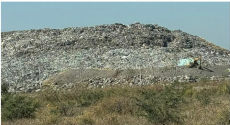
CON TOTAL IMPUNIDAD sigue operando el tiradero a cielo abierto "La Perseverancia" en Cuautla

Finalmente, los denunciantes señalaron que entre las principales causas de muerte en el estado están las malformaciones congénitas, leucemia linfoblástica aguda, neumonías y diabetes, lo que hace urgente la intervención de las autoridades gubernamentales para frenar la operación irregular de este tiradero y proteger la salud de los morelenses.