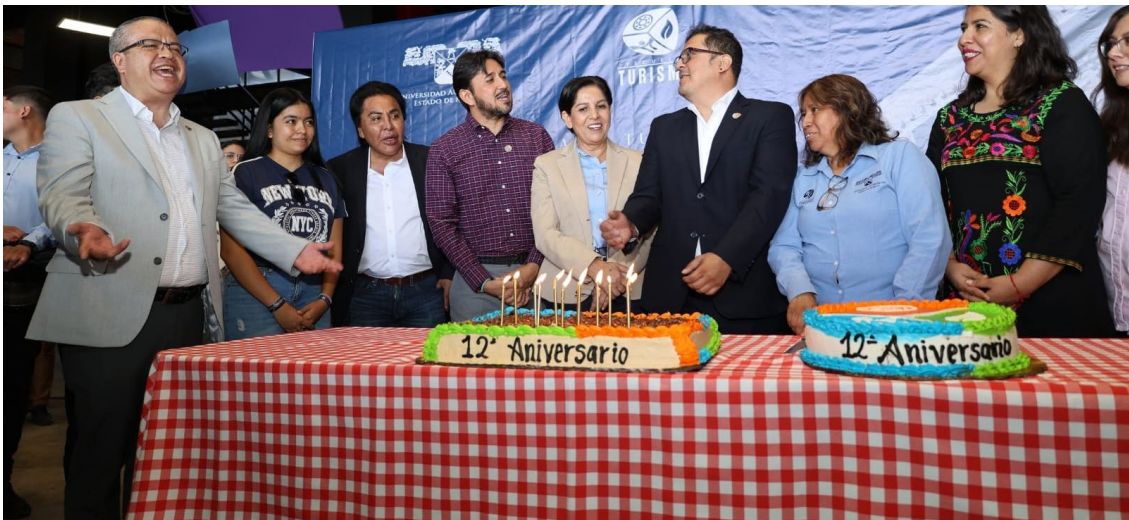
LA ESCUELA DE Turismo de la Universidad Autónoma del Estado de Morelos (UAEM), celebró su 12 aniversario de creación en la Plaza Cultural 19/S/17, donde estuvieron presentes docentes, funcionarios y comunidad estudiantil.