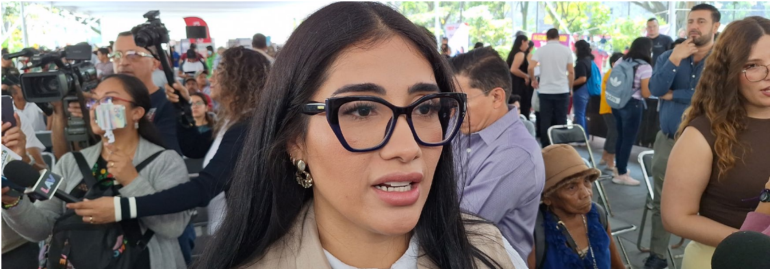
EL SERVICIO NACIONAL del Empleo (SNE) en Morelos alertó a la ciudadanía sobre estafas de falsas ofertas de trabajo en otras entidades del país.

credibilidad a sus propuestas. Pero pidió a la ciudadanía que busca un empleo que naveguen en páginas oficiales y no sigan sitios web falsos. Alertó sobre ofertas laborales en las redes sociales donde te "ofrecen un salario muy alto, un sólo un día o pocas horas de joranda laboral, pero seguramente es estafa". La servidora pública aseguró que hasta el momento no han detectado páginas de ofertas laborales falsas ni han recibido denuncias. Incluso recomendó a que se acerquen a las tres oficinas del SNE. Finalmente, la directora del Servicio aclaró que los trámites son gratuitos, no se cobra por vincular a las personas con las empresas y no existen intermediarios.