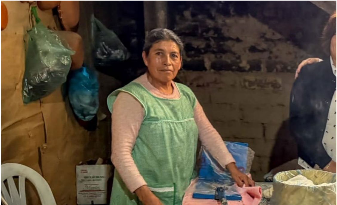
EN EL MARCO del Viernes Santo y como parte de las acciones de promoción del turismo cultural y religioso en el estado, autoridades de la Secretaría de Turismo de Morelos recorrieron el municipio indígena de Hueyapan.