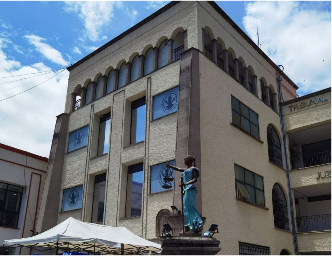
ABOGADOS DE MORELOS hicieron un llamado a los magistrados del Tribunal Superior de Justicia para que una vez que regresaron de vacaciones dejen de lado los conflictos por el poder y se pongan a trabajar para terminar con el rezago que hay en la impartición de justicia.