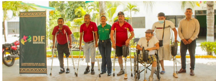
EL SISTEMA PARA el Desarrollo Integral de la Familia (DIF) Emiliano Zapata entregó cinco prótesis de pierna a bajo costo a personas en situación de vulnerabilidad

significa para ellas la posibilidad de retomar sus actividades diarias, recuperar su independencia y mirar el futuro con mayor esperanza. El DIF Emiliano Zapata refrenda su compromiso de seguir generando acciones que toquen vidas y construyan un municipio más incluyente y solidario.