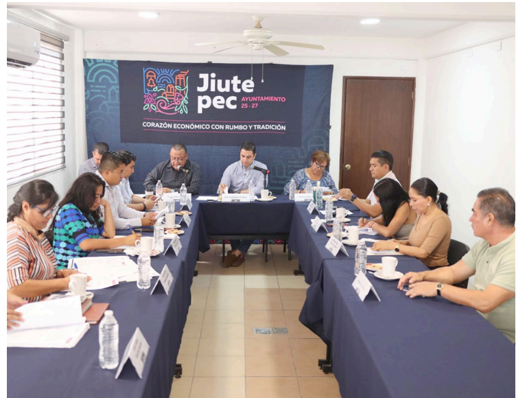
DURANTE LA OCTAVA Sesión Ordinaria de Cabildo de Jiutepec, se aprobaron importantes acuerdos en beneficio de nuestra comunidad.