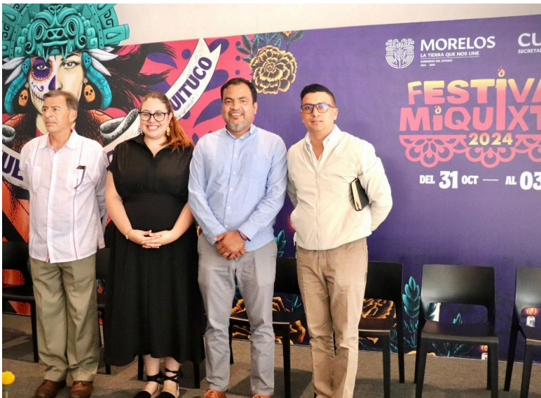
EN EL MARCO del 31° Festival Miquixtli "Origen, Memoria y Ritual", el Instituto del Deporte y Cultura Física del Estado de Morelos (Indem) invita a participar en la carrera atlética nocturna que se desarrollará el próximo 02 de noviembre.