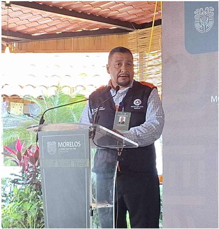
UNA MUJER ES rescatada tras caer accidentalmente a un pozo profundo en la comunidad de Atlatlahucan y que permaneció en el interior hasta por cuatro días continuos.

auxilio, acudimos de manera inmediata, logrando rescatar a una joven mujer de 32 años de edad”, expresó. El pasado 19 de octubre, protección civil estatal y paramédicos acudieron a un llamado de emergencia en Atlatlahucan, para dar los primeros auxilios a la mujer, luego de haber caído a un pozo accidentalmente en dicha comunidad, después de cuatro días de estar vulnerable dentro de este pozo. El coordinador estatal lo calificó como una situación grave que colocó a la femina en una situación de peligro, ya que, estuvo cuatro días seguidos dentro del pozo sin comer y sin hidratarse, lo que puso en juego la vida de esa persona.