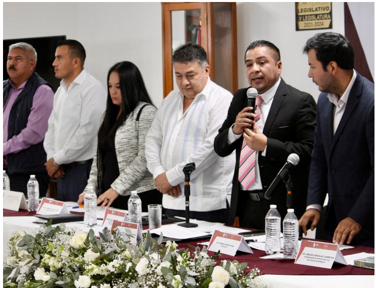
DESDE EL PODER Legislativo se convertirán los diputados locales en “facilitadores de las herramientas jurídicas y normativas”

so con la transparencia y la inclusión en el trabajo legislativo. Los diputados que integran esta comisión se comprometieron a escuchar las inquietudes de la ciudadanía y a traducirlas en propuestas concretas que fortalezcan la legislación en materia de seguridad y protección civil; a través de un diálogo constante, buscan fomentar un ambiente de confianza y colaboración entre la población y las instituciones. Entre los asistentes se encontraban representantes de diferentes agrupaciones y asociaciones civiles que, junto a los líderes de colonias y ayudantes municipales, expresaron su interés en colaborar activamente con las autoridades para construir un entorno más seguro. La participación de la sociedad civil es fundamental, ya que son ellos quienes viven de cerca las problemáticas relacionadas con la seguridad y la convivencia en sus comunidades.