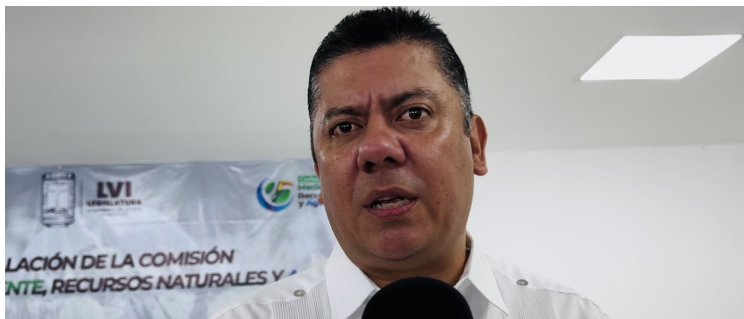
EN DÉFICIT DEL 50 por ciento de los mantos acuíferos subterráneos que se encuentran dentro de estado, esta afectando principalmente al sector agrícola en Morelos.

para la alimentación de los pozos tanto agrícolas como de agua potable, con una cantidad de 117 pozos en 26 municipios, principalmente en la zona oriente y sur poniente del estado. Indicó que es fundamental trabajar de la mano con la Secretaria de Desarrollo Agropecuario (Sedagro), para la tecnificación del riego con la rehabilitación de pozos de agua. Señaló que buscarán colaborar con los presidentes municipales, para evitar pérdidas y fugas importantes del líquido vital en la distribución del agua en prácticamente todos los municipios que conforman la entidad. El titular confirmó que la zona oriente del estado como el sur poniente también, son los puntos con mayor afectación en el sector agrícola por falta de agua y que presentan mayor complicaciones.