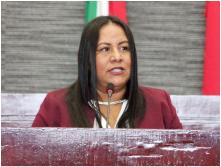
REVISARÁN EN EL Congreso del Estado que se cumpla la Ley para no permitir que haya impunidad ni opacidad en el caso de la diputada Tania Valentina Rodríguez Ruiz

Partido del Trabajo, es acusada por la Fiscalía Anticorrupción de que, presuntamente, facilitó una camioneta de su propiedad a personajes con drogas y armas de uso exclusivo del ejército.