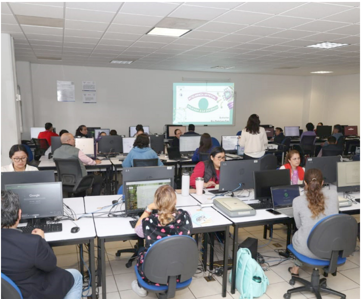
SE LLEVÓ A cabo el curso Inteligencia Artificial en el diseño didáctico de la docencia, en el centro de cómputo de la Facultad de Medicina de la Universidad Autónoma del Estado de Morelos (UAEM), al que asistieron académicas y académicos del área de la salud.