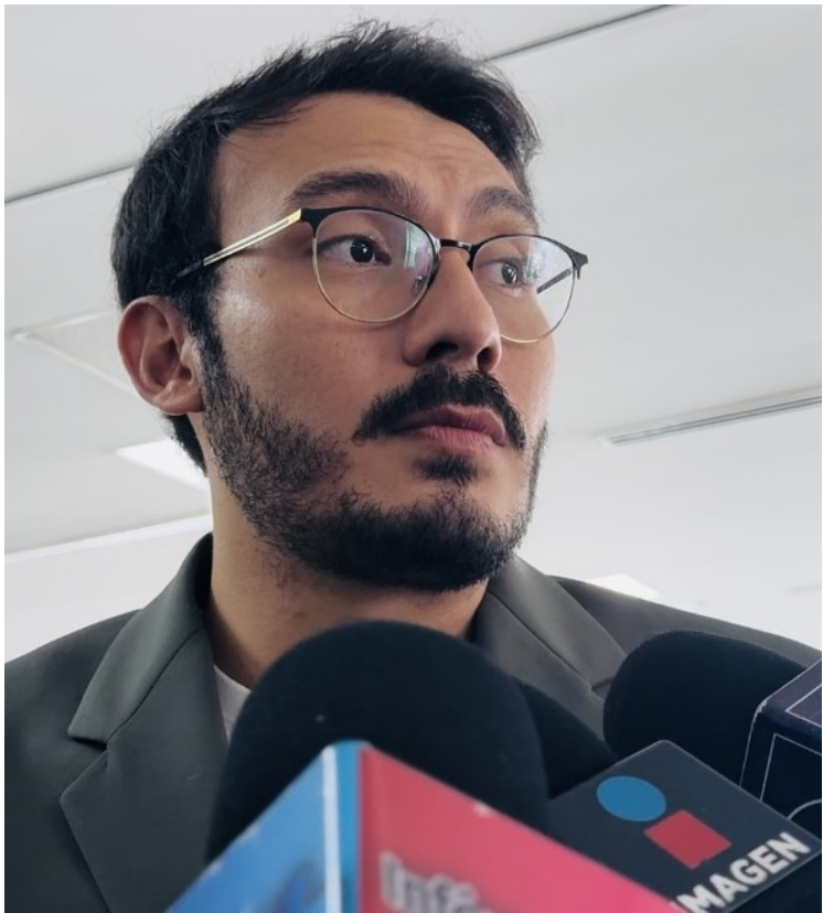
DESDE LA NORMATIVA, la Secretaría de Desarrollo Sustentable (SDS) del Gobierno de Morelos, trabaja en coordinación con el Instituto Nacional Electoral (INE), para ya no otorgar más identificaciones oficiales que pertenezcan a direcciones o domicilios dentro de las Áreas Naturales Protegidas (ANP).

El titular de la secretaría señaló que, se está llevando a cabo un censo para cuantificar las viviendas que han sido construidas de manera irregular en las áreas naturales protegidas y el gobierno del estado cuenta con las atribuciones para corroborar y procurar la conservación del espacio y avanzando en la estrategia integral de atención.