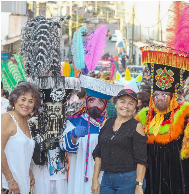
A PESAR DE la gran afluencia de personas que acuden a los carnavales, en Jiutepec no hubo aumento de ventas para los comercios establecidos, ya que los turistas compran en los puestos ambulantes que se colocan en estas festividades.

gente consume más de lo que tiene a la mano y en esos recorridos y en esa estructura del carnaval", concluyó López Jiménez. Y es que cabe mencionar que durante este fin de semana inició la temporada de carnavales con el de Jiutepec, en donde se pudo observar la gran cantidad de personas que acudieron a disfrutar de este evento.