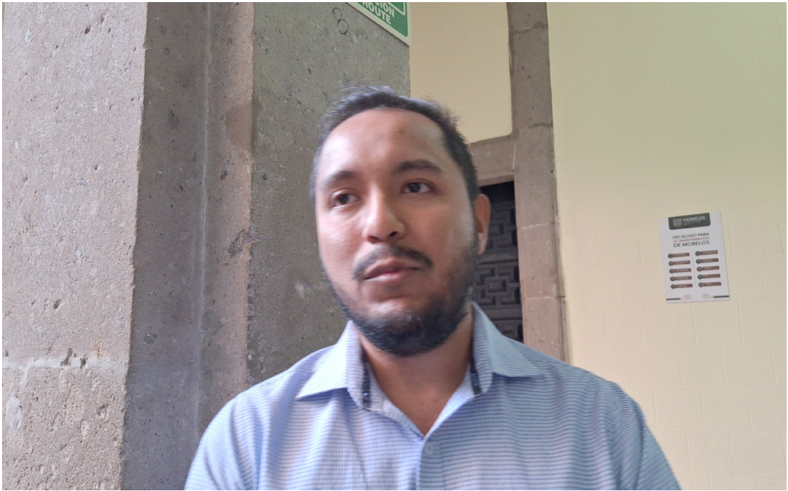
EN LO QUE va del año suma 48 personas desaparecidas en Morelos, informó la Comisión de Búsqueda de Personas Desaparecidas del Estado.