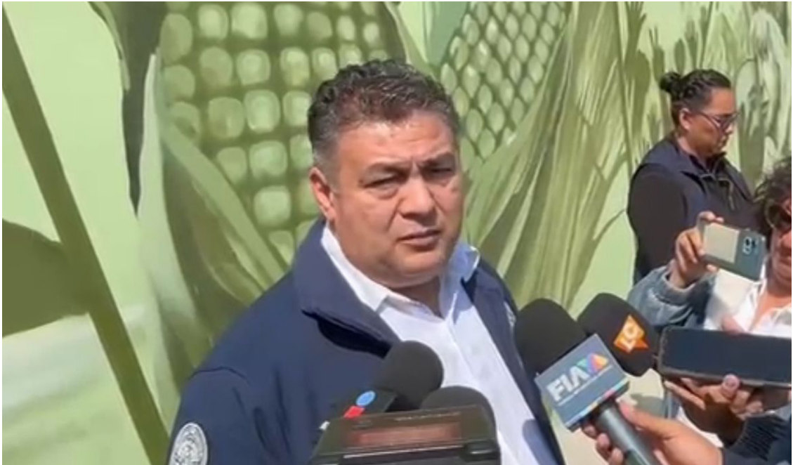
ANTE LOS CONCIERTOS que se realizarán en los próximos días en Morelos, la Secretaría de Seguridad y Protección Ciudadana exhortó a los organizadores a contratar seguridad privada con el fin de evitar que ocurran disturbios.