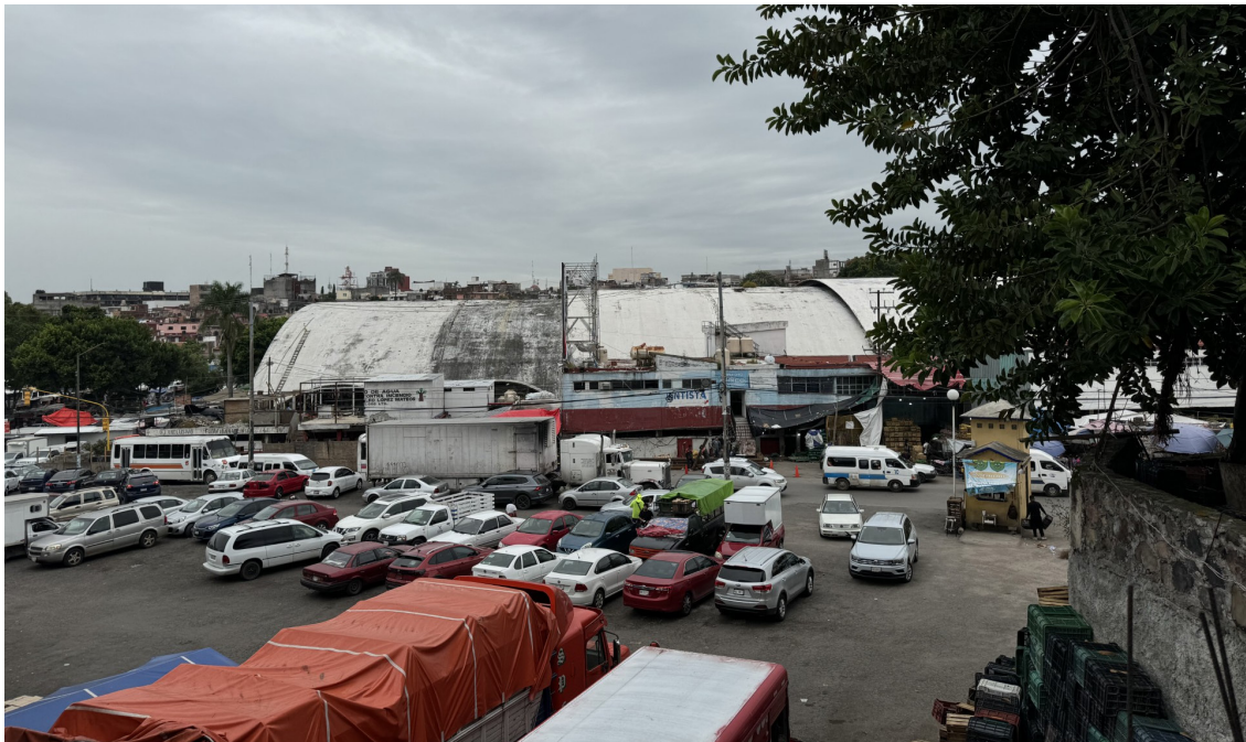
COMERCIANTE DEL MERCADO Adolfo López Mateos en Cuernavaca, requieren de l apoyo de la autoridad municipal para el servicio de la recolección de basura en el centro comercial.

a que la sociedad los encharcamientos de agua y la basura de todo tipo, ha sido un problema grave desde hace más de un año que fueron removidos.