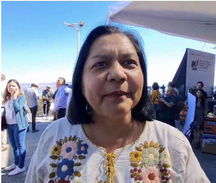
SE REQUIERE DE la rehabilitación de canales y sistemas de riego para el trabajo de las parcelas en Morelos, de acuerdo con la Secretaría de Desarrollo Agropecuario (Sedagro).

ganaderos de la entidad esperan que las autoridades que los representan trabajen para el desarrollo económico, ya que, en sexenios pasados sólo han demostrado desinterés y desatención para ese sector, lo que representa pérdidas económicas y afectaciones en la agricultura y ganadería de Morelos.