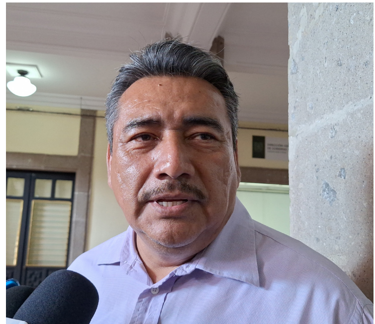
ANTE LA ÉPOCA de estiaje y las pocas lluvias que se preveen en este año, el Gobierno del estado trabaja en un plan integral para que las comunidades no sufran de la falta de agua.

temporada de estiaje. También mencionó que existen conflictos por la falta de agua entre Tetela del Volcán y un municipio de Puebla por la disputa, debido a que comparten recursos hídricos. "Hay un problema con un municipio de Puebla que está en los límites Morelos. Es un conflicto que puede ser el resultado de la escasez de agua potable, la sequía, o la contaminación. Reveló que también hay mesas de trabajo con Estados vecinos como Puebla y el Estado de México, tanto por el tema de los límites territoriales, como por la disputa del agua. En el caso de conflictos territoriales con Puebla, el funcionario estatal dijo que "son asuntos que se dejaron pendientes, pero hemos visto la cordialidad, aparte de lo estamos convocando para hacer un estudio técnico y darle solución".