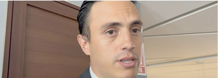
EL COORDINADOR DEL Grupo Parlamentario del PAN en el Congreso local, expresó su postura en torno a la reelección, comentando que, en algunos municipios, esta ha sido beneficiosa.