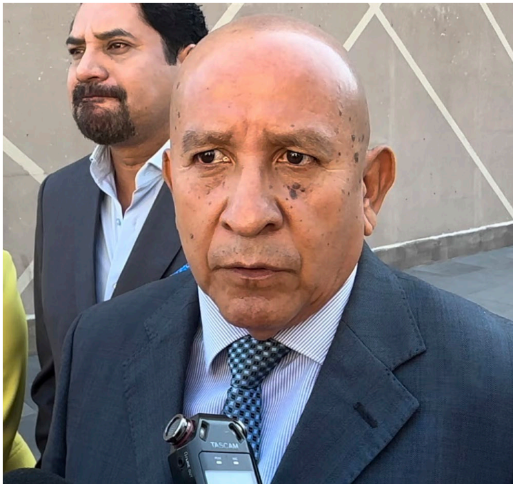
ABOGADOS DE MORELOS acudieron al Congreso del estado para solicitar que se lleven a cabo mesas de trabajo para analizar la reforma al Poder Judicial.