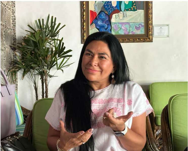
ENFERMEDADES RARAS CARECEN de tratamiento y no hay un registro de pacientes, lamentaron especialistas médicos.

millones sufren enfermedades raras en México y en Morelos se desconoce el número de pacientes porque no existe un registro. Dijo solo el cinco por ciento de los pacientes llevan un tratamiento específico, pero se requiere capacitación de los médicos para identificar los síntomas y dar un diagnóstico acertado. Además, indicó que las autoridades deben destinar presupuestos para dar la atención a los pacientes para que aspiren a una mejor calidad de vida. La oncóloga dijo que en Morelos hay una alta incidencia de Amiloidosis sobre todo en Puente de Ixtla con más de 50 casos.